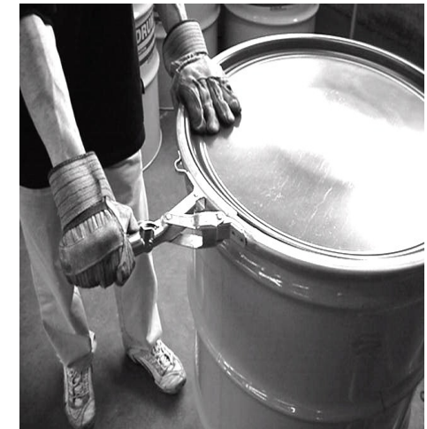
Figure 8 – Palanca deberá cerrarse lentamente