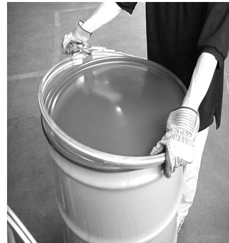
Figure 7 – Abra el anillo para ser instalado